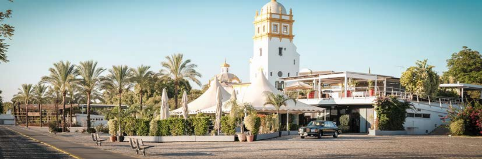
Restaurante Muelle Delicias